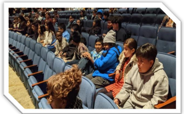
Algunas fotos del evento